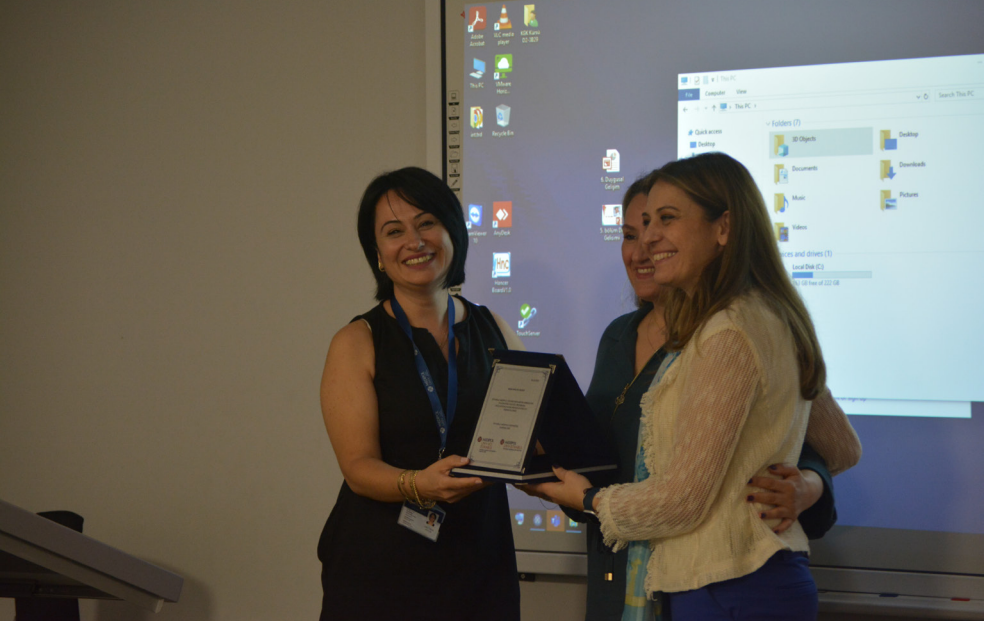
Tablo 5. Mene Health Group Semineri

İkinci Kariyer Fuarı'nda iş dünyasının önemli isimlerini ağırlanmış, öğrenci ve mezunların kariyer gelişimlerine ışık tutacak bir dizi bilgi ve deneyim aktarımı sunulmuştur. Fuarda yer alan konuşmacılar ve sunum başlıkları Tablo 5, 6 ve 7'de belirtildiği şekildedir.