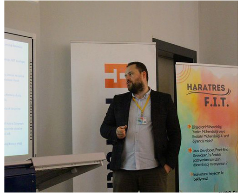
Tablo 7. World Medicine Semineri